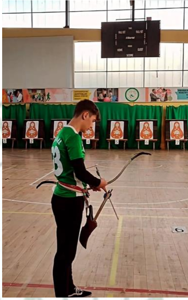
Geleneksel Okçuluk Turnuvası