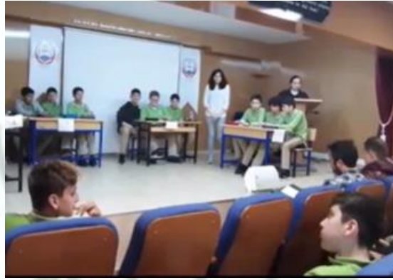
Sınıflar Arası Bilgi Yarışması