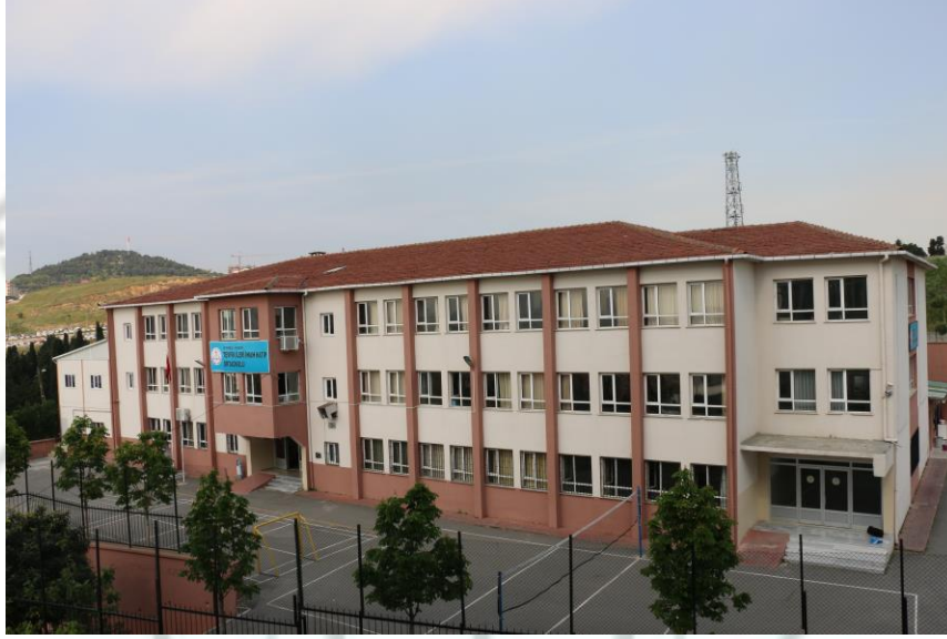
OKUL BİNASI DIŞ GÖRÜNÜM