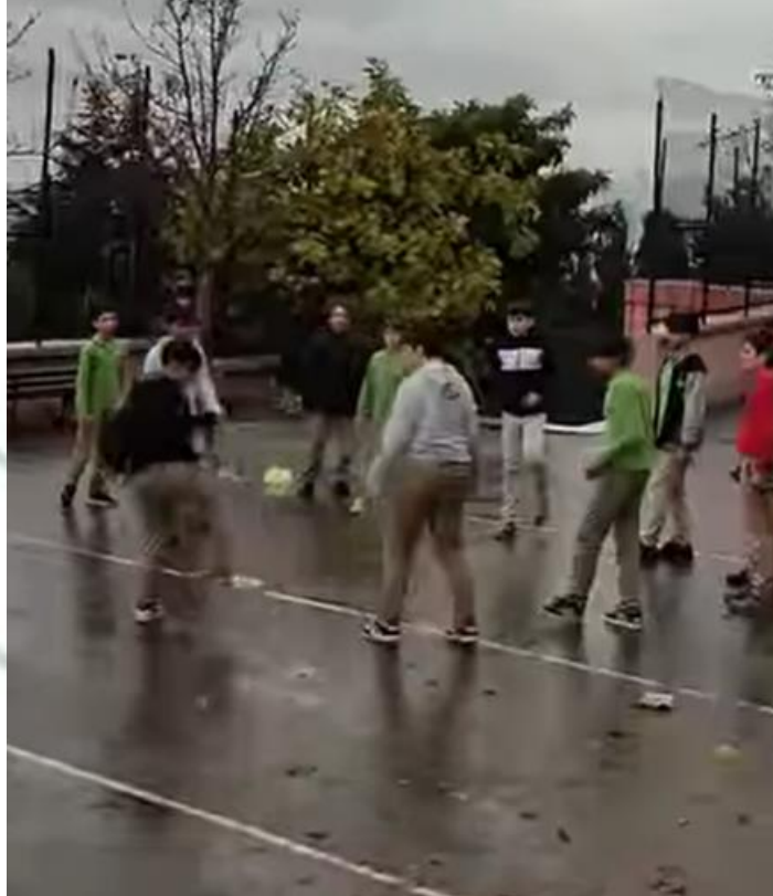
Sınıflar Arası Mini Futbol Turnuvası