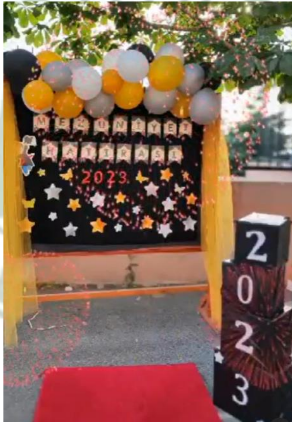
8. Sınıflar Mezuniyet Töreni