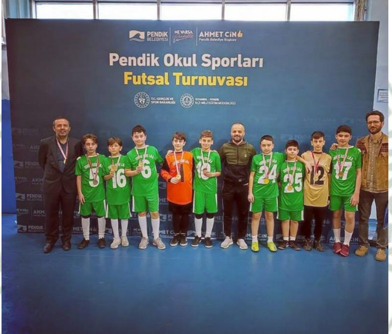
Okul Futsal Takımı İlçe Birincisi